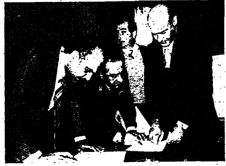
الوزيران بطرس وسلمان خلال الجلسة أمس

عقدت لجنة الإدارة والدفاع الوطني اجتماعاً مشتركاً قبل ظهر أمس، بحضور وزير الدفاع الأستاذ فؤاد بطرس ووزير الداخلية الدكتور المعتمد فؤاد لحود، ورئيس لجنة الدفاع الإدارية والمعدل الأستاذ نديم القادري، وعدد من النواب أعضاء اللجان، وذلك لدراسة مشروع القانون المعدل بإعطاء ترقية عناصر الجيش والأمن الداخلي والأمن القومي، وذلك في إطار خطة وزارة الدفاع، وذلك بحضور الأمين الداخلي، وعدد من العسكريين والخبراء، حيث قدم هؤلاء تقريراً مفصلاً عن سلم الرتب والرواتب التي كان عليها الجيش والدرك، واستندت اللجنة إلى الاتفاقية المبرمة مع الاتحاد السوفياتي والتي تضمنت زيادة رتب الجنود والأمن الداخلي، بحيث تشكل هذه الزيادة مشكلة قانونية لا يمكن تجاوزها خلال إطار مشروع قانون الرتب والرواتب إلا بقانون جديد.